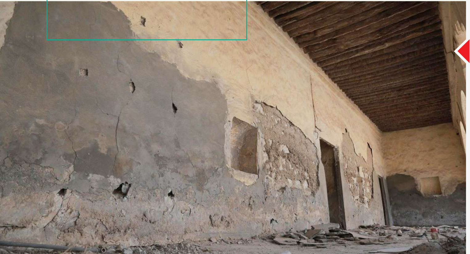
مسجد الشيخ أبوبكر قبل الترميم

تأهيل 30 مسجداً تاريخياً في 10 مناطق مختلفة في المملكة