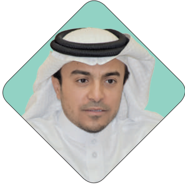
الدكتور إبراهيم آل الشيخ مبارك الأمين العام