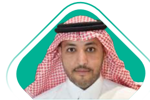
محمد بن عبدالرحمن العفالق النائب الأول