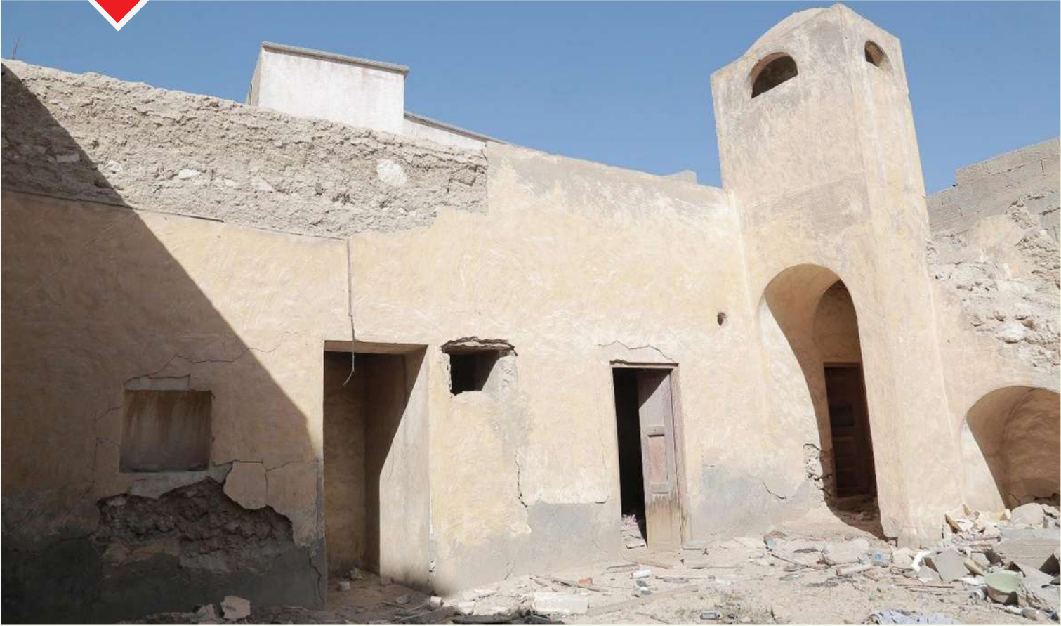
مسجد الحبيش قبل الترميم

الهجري، ويُعد من أقدم المساجد التراثية بالمدينة، حيث ظل لعقود يمثل منارة علمية لطلاب العلم في الأحساء، وقد درّس فيه الشيخ عبدالعزيز بن صالح العلجي الذي كان من كبار العلماء بالأحساء في الفقه والنحو.