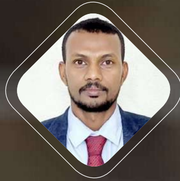
بقلم: د. محمد عبدالله حسن باحث وممارس جودة وكايزن

اهتمت كثير من دول العالم المتقدم منذ زمن بعيد بمنهجيات التحسين المستمر في إدارة الأعمال والإنتاج والتصنيع وتجويد الخدمات والمنتجات، فظهر ما يعرف بالتفتيش والرقابة مروراً بتوكيد وضمان الجودة إلى أن جاءت منهجية الجودة الشاملة لتظهر بعدها منهجيات مصاحبة مثل منهجية سيجما ستة ومنهجية الكايزن وغيرها.