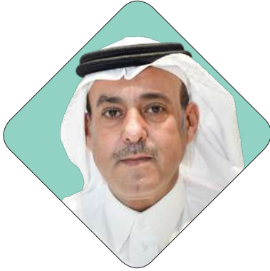
عبدالعزيز بن صالح الموسى رئيس مجلس إدارة غرفة الأحساء