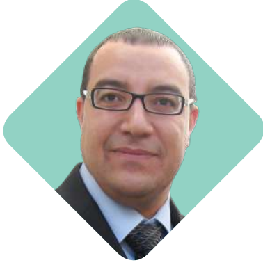
بقلم: د. عماد حمادي البجوي أستاذ التحكيم التجاري الدولي

التي ستسهم بدورها في تحقيق النمو الاقتصادي والاجتماعي. وقد قامت الغرفة بتسخير جميع إمكانياتها أمام الخبراء والمختصين لإعداد لوائح وأنظمة المركز ومناقشتها ومقارنتها مع الأنظمة الأساسية للمراكز المحلية والإقليمية والدولية تمهيدا لاعتمادها وإصدارها. وتعمل الغرفة على اعتماد الهيكل التنظيمي للمركز واللوائح الخاصة به، والبدء في تسجيل المحكمين والخبراء المعتمدين واختيار الكفاءات والخبرات والكوادر الوطنية المتمرسّة والقادرة على إدارة مركز التحكيم التجاري، والترويج لهذا المركز في مجتمع المال والأعمال وبين مؤسسات وشركات القطاعين الخاص والعام محلياً وإقليمياً ودولياً، والتعريف بالمزايا التي يقدمها هذا النوع من القضاء، خلافاً عن القضاء العادي.