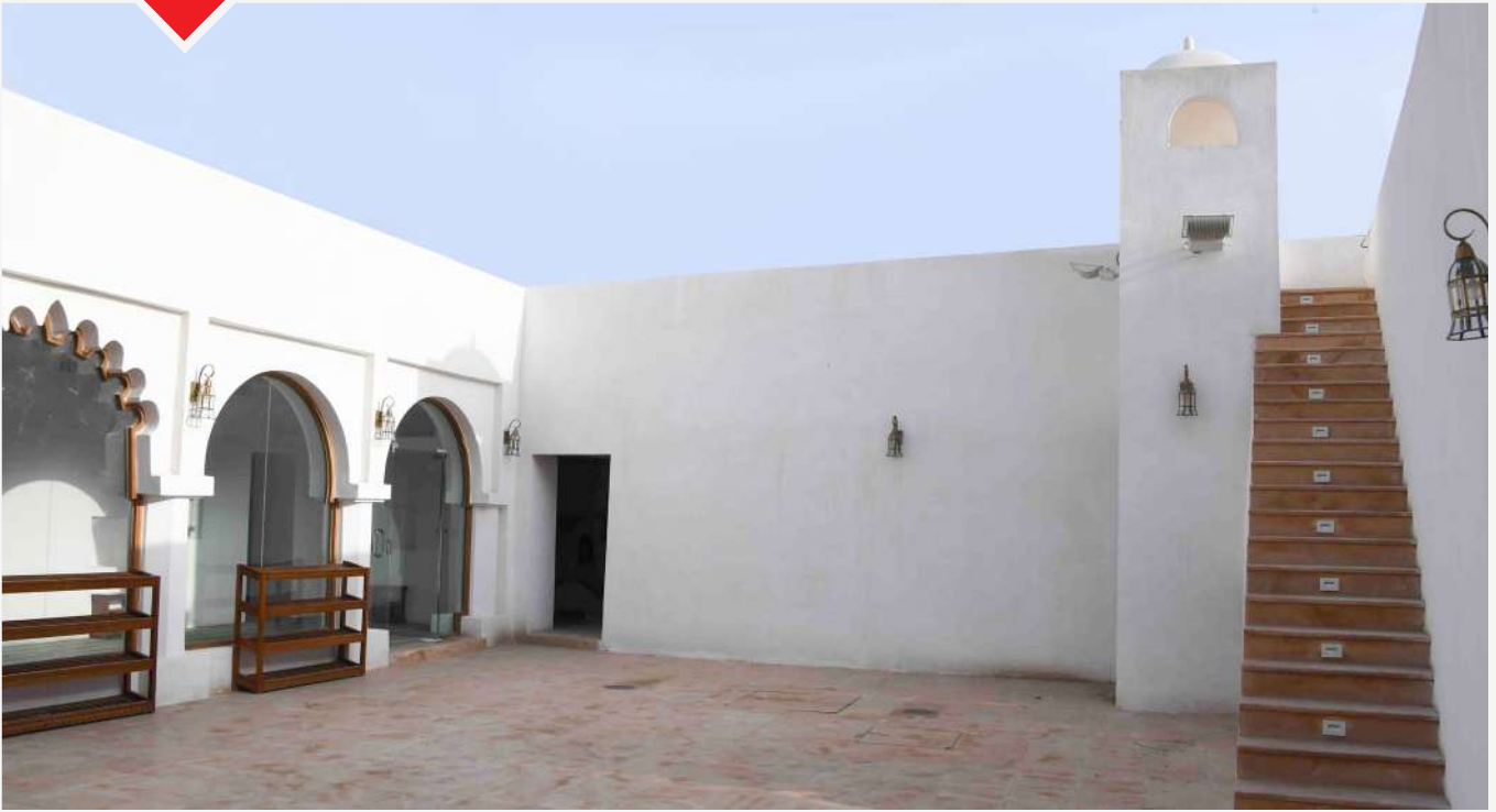
مسجد الحبيش بعد الترميم