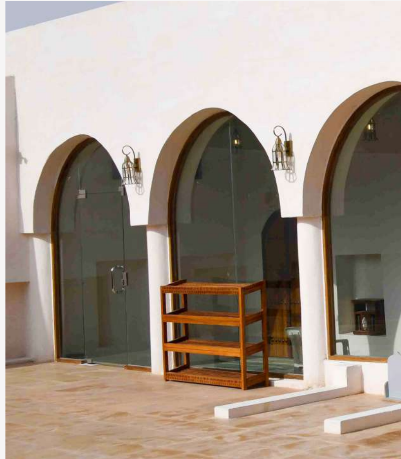
مسجد الشيخ أبوبكر بعد الترميم

وجاء توجيهه ومتابعة سمو ولي العهد نائب رئيس مجلس الوزراء وزير الدفاع الأمير محمد بن سلمان لتطوير وتأهيل 130 مسجدًا تاريخياً على مراحل عدة، تأكيداً على اهتمام وعناية المملكة بإحياء القيمة العلمية والتاريخية للمسجد، بالإضافة إلى القيمة الثقافية والروحانية